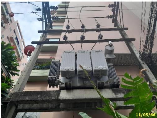
หม้อแปลงไฟฟ้าโครงการ