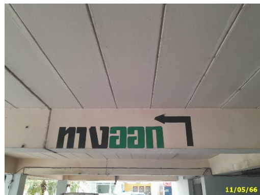
ทางเข้า-ออกโครงการ