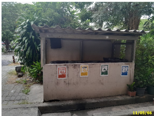
ถังรองรับมูลฝอยอาคาร