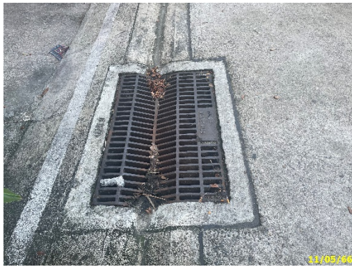
ท่อระบายน้ำออกสู่สาธารณะ