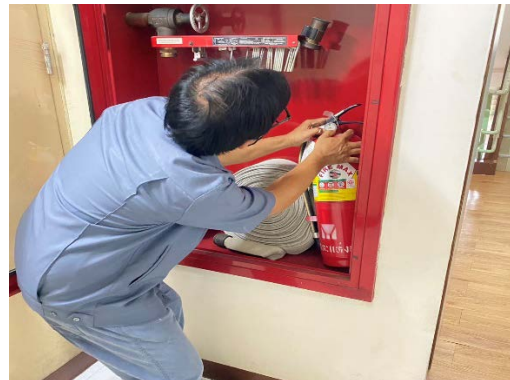
ดูแลตรวจสอบระบบป้องกันอัคคีภัย