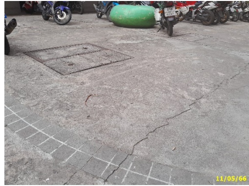
พื้นที่ตั้งระบบบำบัดน้ำเสีย