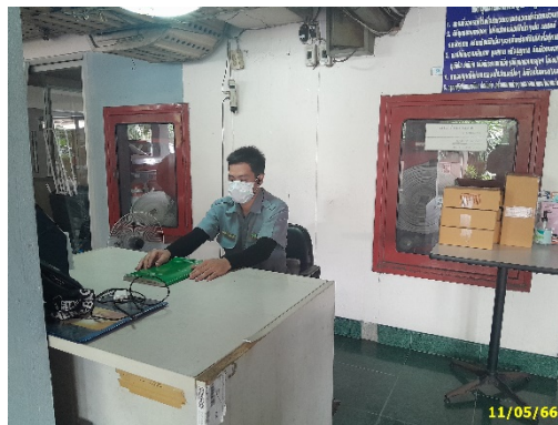
เจ้าหน้าที่รักษาความปลอดภัย