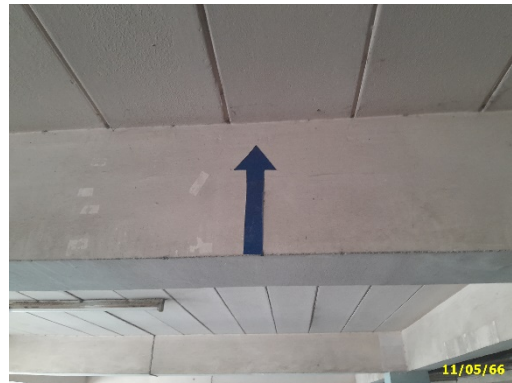
สัญลักษณ์การจราจร