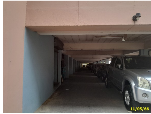
พื้นที่จอดรถ