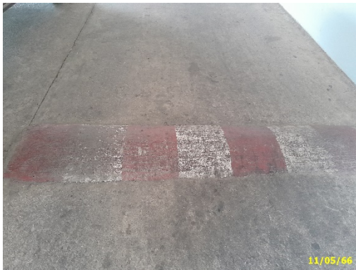
สัณฐานชะลอความเร็ว