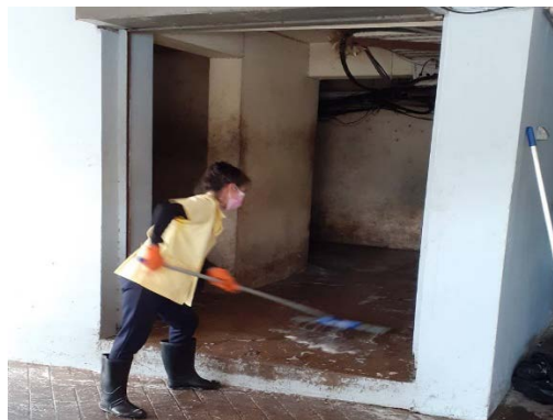
ทำความสะอาดหลังการเก็บขน