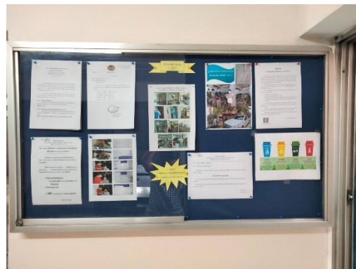
ป้ายรณรงค์การคัดแยกมูลฝอยก่อนทิ้ง