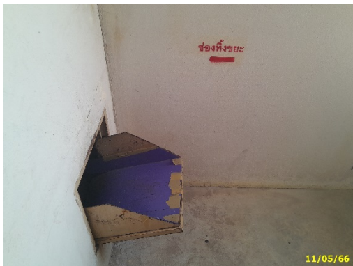
ช่องทิ้งมูลฝอยประจำชั้นของอาคาร