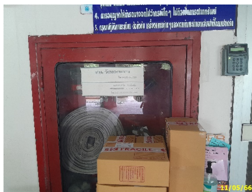
ตู้ดับเพลิงพร้อมหัวฉีด พร้อมอุปกรณ์