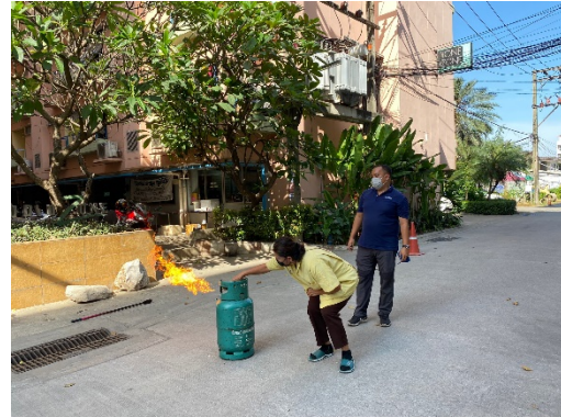
ภาพที่ 2.2-8 การซ้อมอพยพเพลิงไหม้