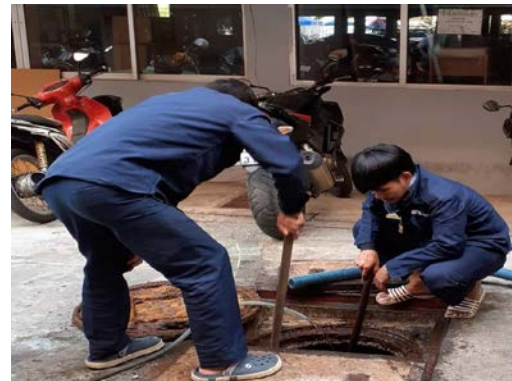
ภาพที่ 2.2-4 การสูบน้ำจากระบบบำบัด (ครั้งสุดท้าย)