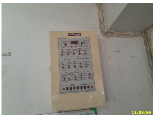
แผงควบคุม